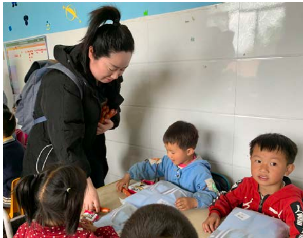
大千挚爱公益基金会拜访幼儿班