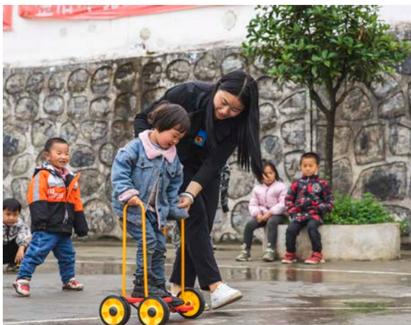
幼儿班户外活动课