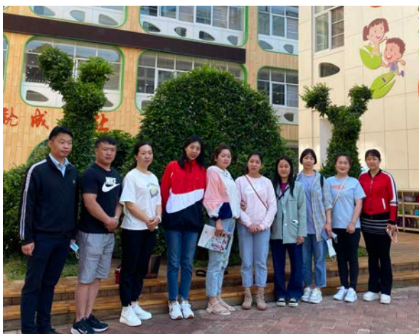
项目人员外出参观学习