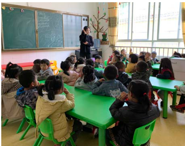
幼儿班日常教学活动