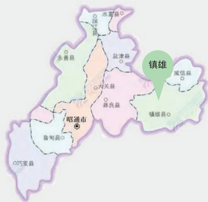
镇雄县位于云南省东北