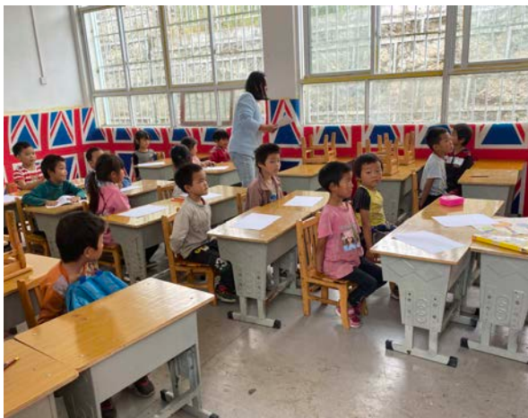
项目前期基线调查