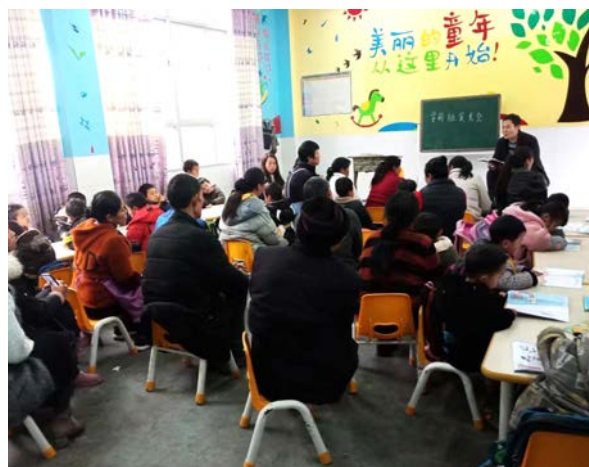
幼儿班召开家长会议