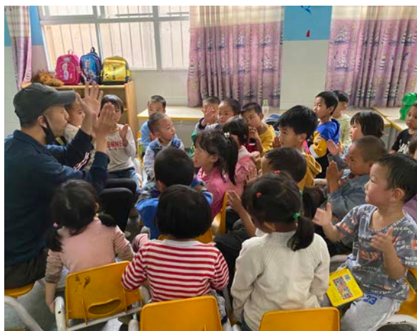
机构培训师与孩子们互动