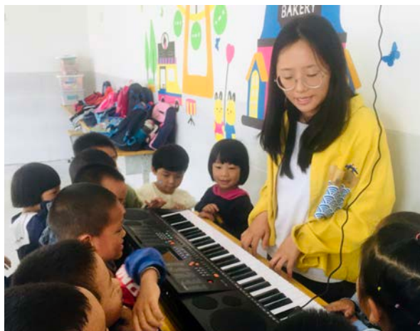
幼儿班开展区角活动