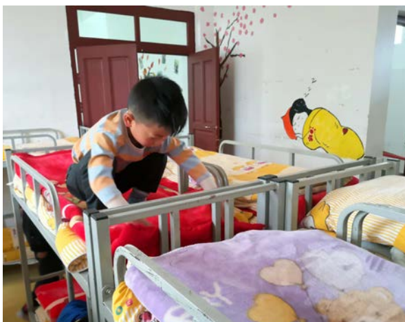
培养孩子良好的生活行为习惯