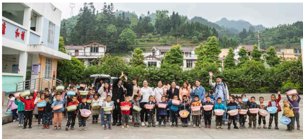
波克基金会拜访乐利幼儿园合影