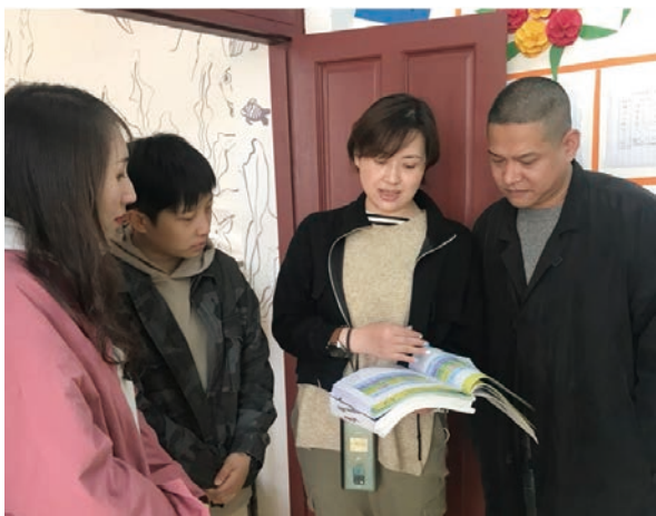
上海砖石信息科技有限公司拜访幼儿班