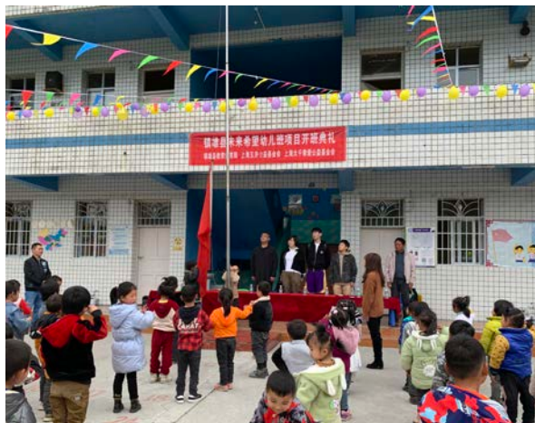
幼儿班举行开班典礼