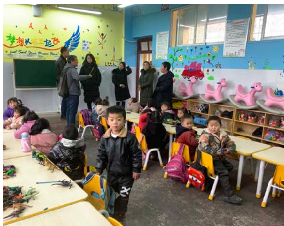
中华少年儿童慈善救助基金会拜访幼儿班