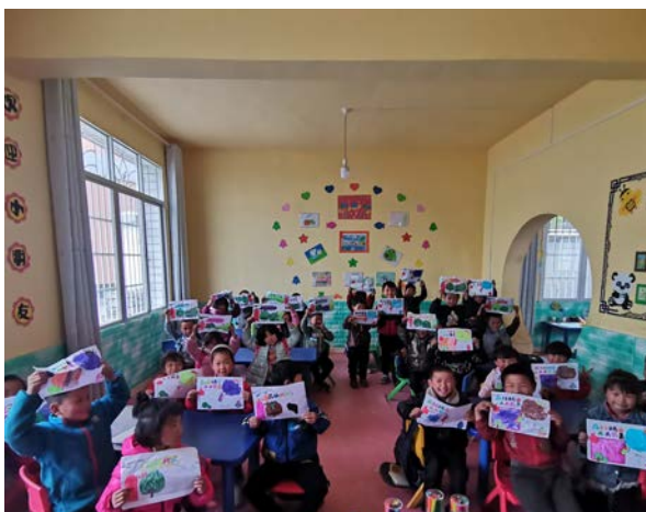
孩子们展示绘画作品